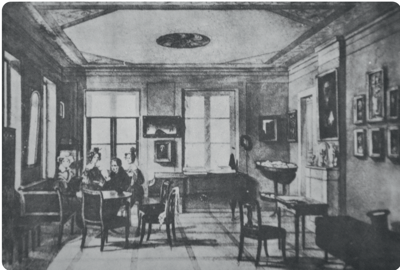
Pokój w mieszkaniu Chopinów przy ulicy Krakowskie Przedmieście w Warszawie. Akwarela Antoniego Kolberga