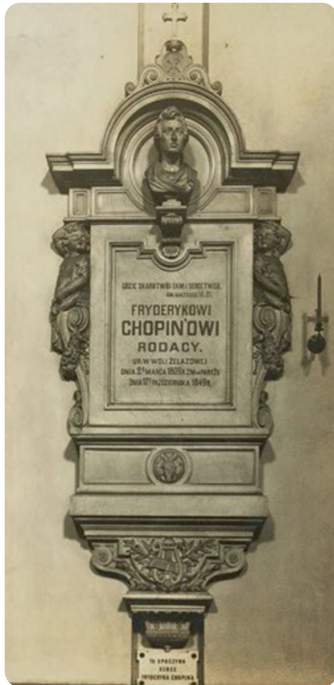
Epitafium z urną z sercem Fryderyka Chopina w warszawskiej bazylice Świętego Krzyża

Епітафія на пам'ятній дошці на одній з колон базилики Святого Хреста у Варшаві, де знаходиться ніша з урною із серцем Фридерика Шопена.