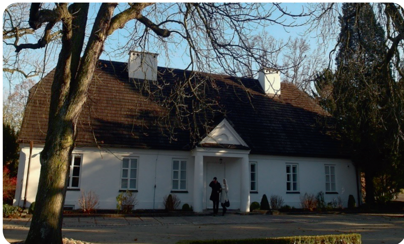
Żelazowa Wola, dworek, w którym urodził się Fryderyk Chopin Autor: Mathiasrex, Maciej Szczepańczyk. Źródło: Wikimedia Commons /domena publiczna

Ципріан Каміль Норвід, «Некролог Фридерика Шопена», 1849 рік