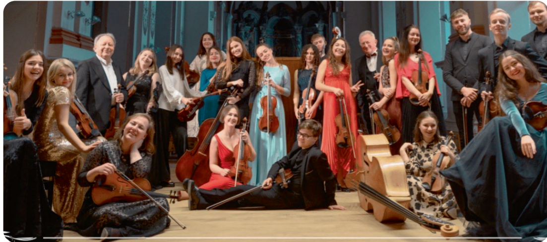
Lwowska Orkiestra Kameralna „Academia”. Foto: z archiwum zespołu