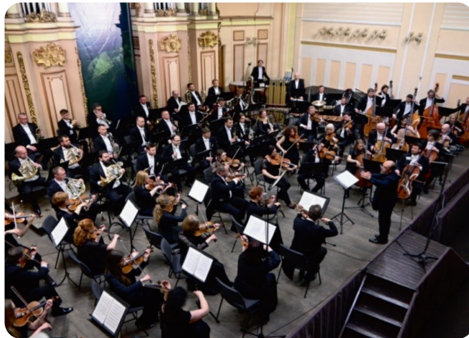
Akademicka Orkiestra Symfoniczna Lwowskiej Filharmonii Narodowej im. M. Skoryka.