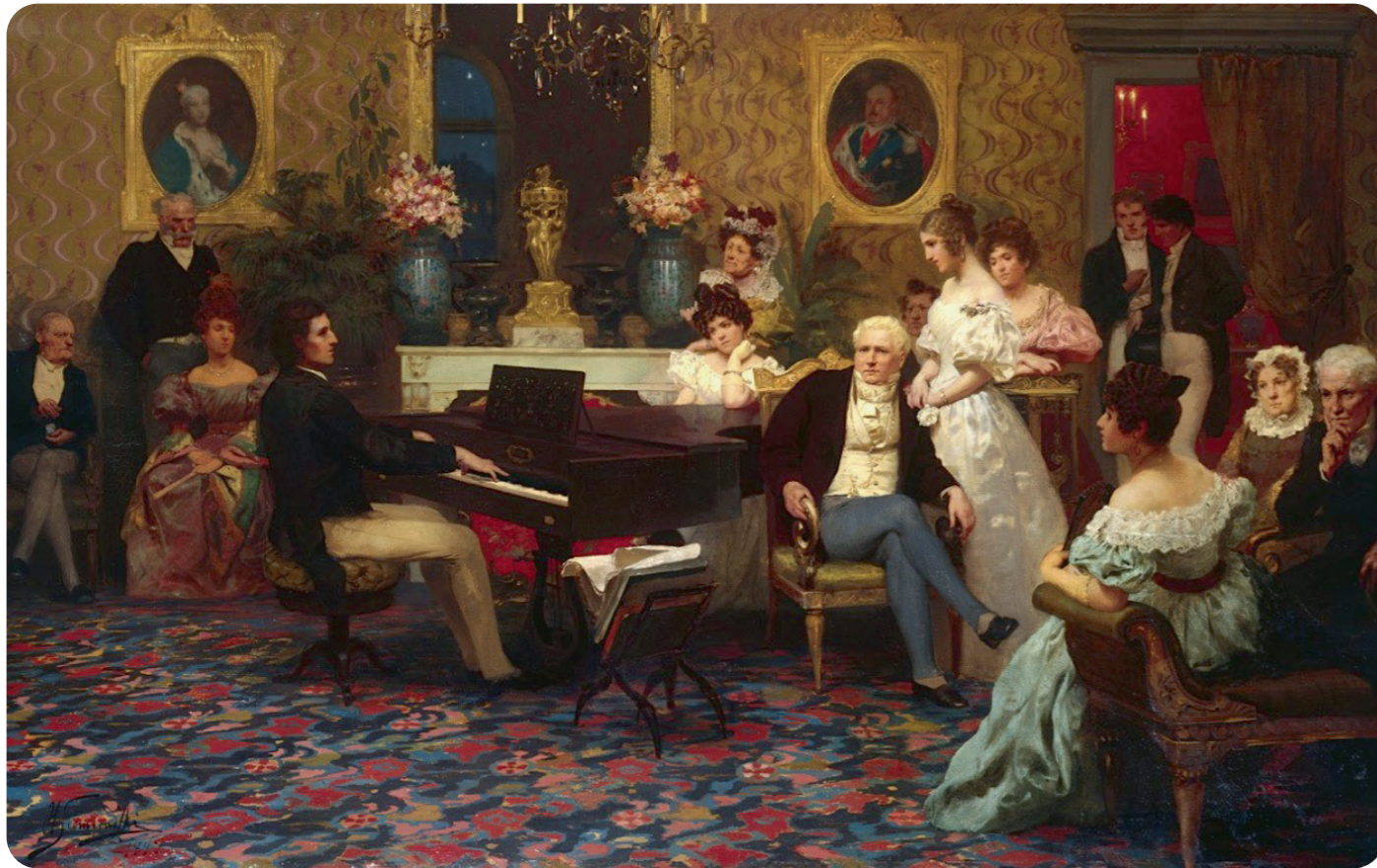
„Koncert Chopinowski” obraz Henryka Siemiradzkiego. Foto: Wikimedia Commons /domena publiczna. Recital kompozytora i pianisty u rodziny Radziwiłłów – 1829 rok