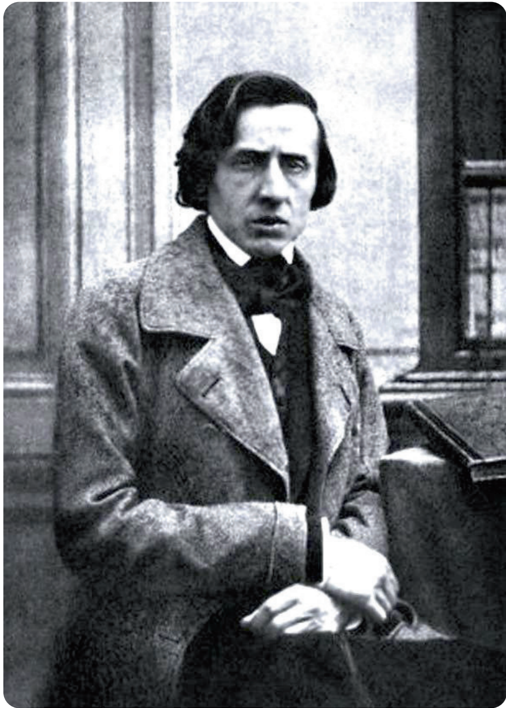
Fryderyk Chopin (1810–1849) Zdjęcie autorstwa Louisa-Auguste'a Bisson'a z 1849 roku Źródło: Biblioteka Narodowa / www.polona.pl